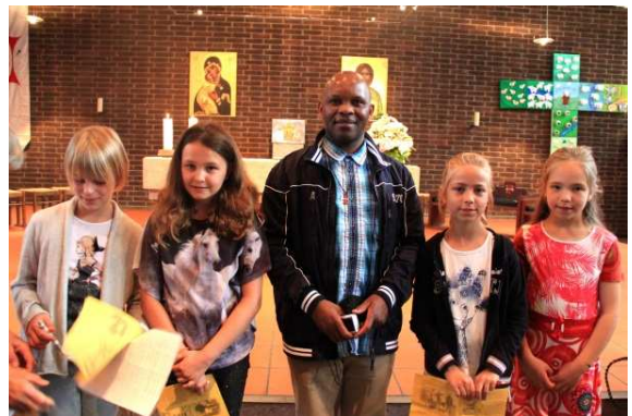
Missionair bewustzijn tijdens liturgie

Ieder jaar worden activiteiten georganiseerd, nu hier dan daar, om de missiepastoraal van de kruisheren te ondersteunen. In Maaseik, in de maand oktober, bij gelegenheid van missiezondag, presenteert de missieprocuur projecten ten gunste van de kruisherenmissie in Indonesië en in Congo. In Uden kent men al verscheidene jaren een solidariteitsactie gedurende de advent en de vasten ten bate van de kruisherenmissies. De giften, die de missieprocuur er ontvangt, zijn bestemd voor diverse pastorale projecten, o.a. pastoraal van de straatkinderen in Kinshasa, ondersteuning van de inspanningen van ouders bij de verbetering van onderwijsstructuren, bijstand aan mensen die geen ziekteverzekering hebben (in poliklinieken en zorgcentra), maar ook om plaatselijke initiatieven voor ontwikkeling te ondersteunen in Indonesië en in Congo.