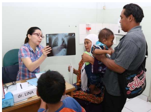
Zorg voor allen

drie dokters aanwezig waren (en dat is nu nóg zo!).