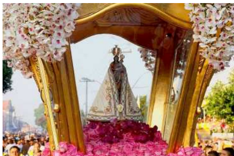
Nossa Senhora de Nazaré

een blijde sfeer van zich beschermd weten door Maria. Dat wordt beleefd in elkaar uitnodigen op een middagmaal. De feestelijkheden duren twee weken; tot aan de "re-Círio" – te vergelijken met het afscheidsliedje van Onze Lieve Vrouw ter Linde in Uden (Noord-Brabant NL) "Adieu, adieu oh Uden,... die ons bewaren moet" tot het volgend jaar op de volgende Mariadagen.