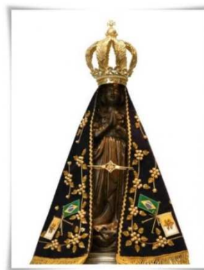
Nossa Senhora Aparecida

in heel Brasil. Tegelijk ook de "Dag van 't Kind"; een hele serie mooie liedjes wordt gezongen. Het beeldje van Nossa Senhora Aparecida is een zwarte Afrikaanse.