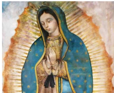
Nossa Senhora de Guadalupe

Guadalupe (México); daar is Maria een Indiaanse, gekleed als een zwangere vrouw; als teken een zwart strikje om haar middel. Zo zijn de drie beeltenissen van Aparecida, van Nazaré, en van Guadalupe een uitdrukking van volkse mariologie. Moge dezelfde Lieve Vrouwe ook onze medemenselijkheid elk jaar doen groeien.