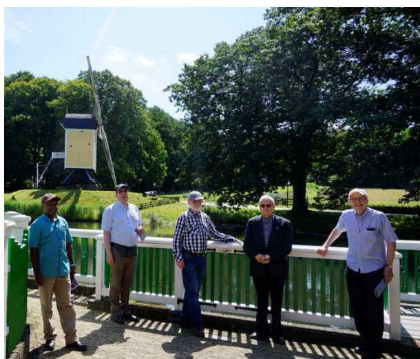
Uit in de open lucht

In de vorige aflevering van Bulletin bemerkte ik op pagina 7 liefst twee foto's die onze huisgemeenschap betreffen. Eén is er ondertiteld met: "Samen op stap:...". Waarom het gebeurd is, weet ik niet, maar in mijn vorig bericht heb ik niet vermeld dat we op vrijdag 21 juli een volle dag, van de openingstijd tot het sluitingsuur over het uitgestrekte terrein van het 'Openluchtmuseum Nederland' te Arnhem zijn getrokken. Persoonlijk vond ik het hoog interessant, vaak ook tot meeleven bewegend, wanneer ik zag hoe mensen hier in vorige eeuwen geleefd en gewoet hebben. Verder beleefde ik vele momenten van herkenning toen ik langs de beelden en voorwerpen die uit de tijd van na de Tweede Wereldoorlog stamden.