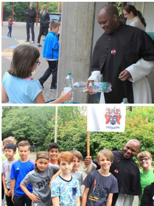
Missieanimatie met scholen

andere vrijwilligers. Bij het hernemen van de lessen in de maand september werden activiteiten georganiseerd in een andere school van Wuppertal.