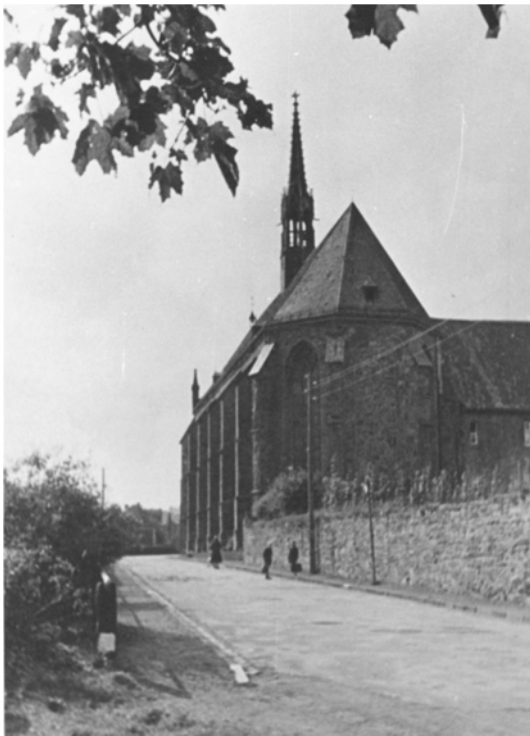
De kloosterkerk in Beyenburg