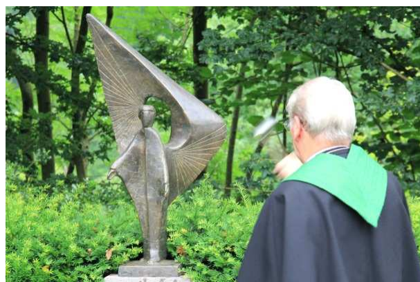
Der Bronze-Engel wird gesegnet

Nach einem Gebet, einer kurzen Stille und der Segnung des neuen Bronze-Engels trafen wir uns im Kloster zu einer lebhaften und geselligen Runde.