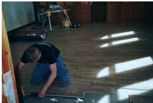
Nieuwe vloer in de lokalen