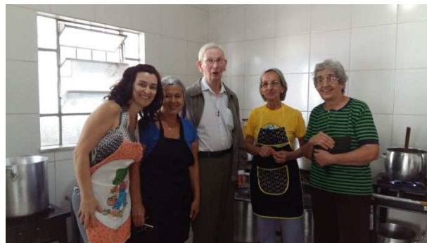
Samen gezonden naar de soepkeuken

lemaal lid van de Sint Vincentiusvereniging. Hun aanwezigheid was telkens een prakti-sche oefening in samenwerking en zen-ding.