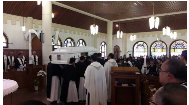
Uittocht uit de druk bezette kerk