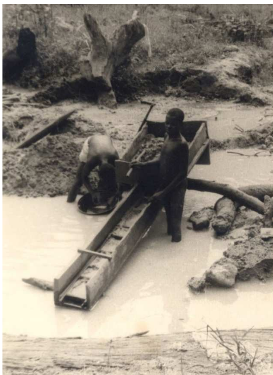
Goudwinning in Buza (streek van Bondo)

De aanstellingen op de missieposten in de jaren vijftig in Bondo waren vaak het resultaat van improvisatie. We vermelden enkele opvallende redenen.