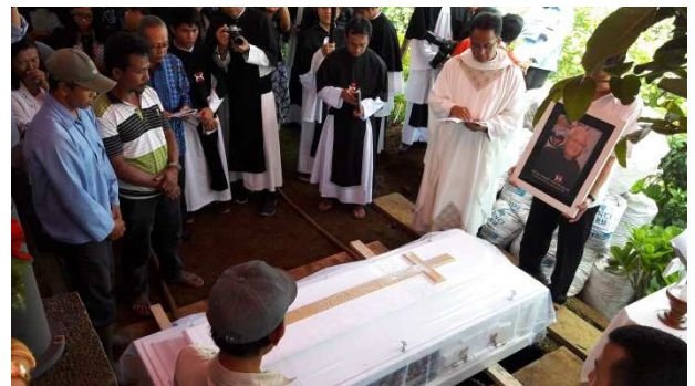
Zegening aan het graf

Daarna ging zijn rondtocht door het bisdom weer verder. Maar opeens werd hij benoemd tot rector van het grootseminarie 'Fermentum' van de wereldheren. En daar heeft ie 4 jaar lang (1987-1990) goede diensten bewezen aan de jonge fraters van het bisdom. In die tijd was hij ook actief in het begeleiden van de 'Marriage Encounter' ("een opfrisser" – cursus voor gehuwden). Jarenlang was hij actief in deze groep.