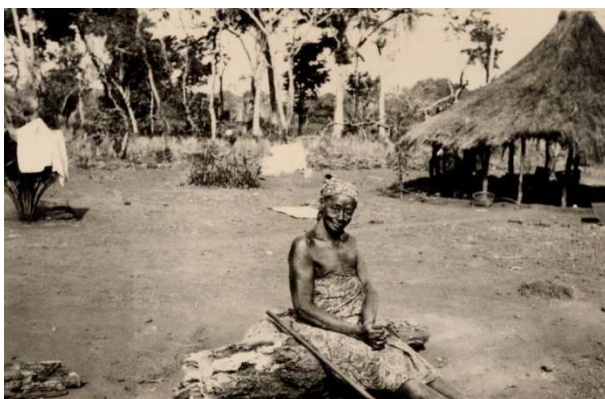
Een oude, melaatse vrouw, doopleerlinge op de missie