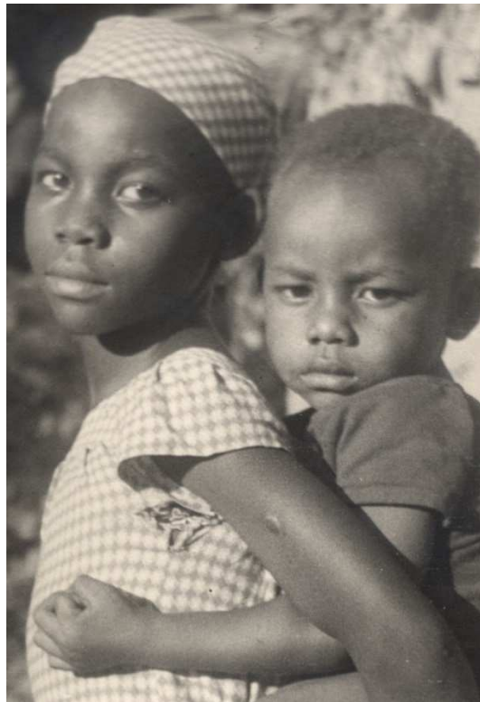
Meisje met haar broertje