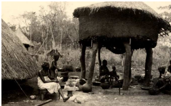
Klaarmaken van het eten onder een afdak op palen

van Tricht naar Ango voor de school, cfr. Kruitwagen naar Monga voor brousse en cfr. Beckers en van Wetten naar Digba. Wat de secretaris van Monseigneur betreft, die blijft secretaris van Monseigneur, maar aangezien hij daar weinig of niets te doen heeft, neem ik hem mee naar Baye, waar hij voor mij werk in overvloed heeft. 3