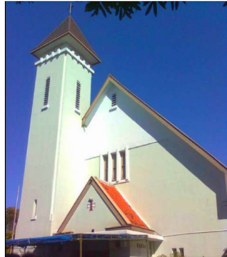
De groene H. Kruiskerk in Bandung

vigen. De kruisherer hadden niet genoeg geld voor deze nieuwe kerk. Milde schenkers betaalden het altaar, de communiebank en ook de Kruisweg. Pastoor van den Boer ontving een fraai orgel met twee klavieren en voetpedalen.