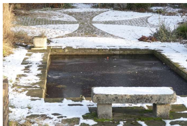
Ijs en sneeuw in Uden

Wie het over het algemeen heel goed kan vinden met Ton is onze Jan van Doren. Hopelijk is dat in deze aangelegenheid ook het geval. Niet dat Jan afstand moet doen van een eigen voertuig. Integendeel, hij heeft een prachtige rollator; wel eens de 'rolls royce' onder de rollators genoemd. Hij gaat die geleidelijk aan ook meer waarderen en gebruiken. Maar het lastige winterweer van de laatste weken speelt hem nu parten; stevige vrieskou, ijzel, soms ook sneeuw, ijzige wind en verraderlijke gladheid.