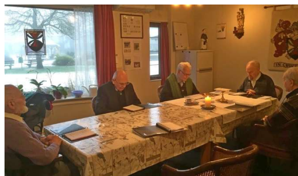
Confraters vieren samen Eucharistie