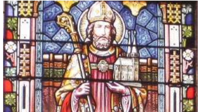
H. Monulfus, bisschop van Maastricht (6 de eeuw)