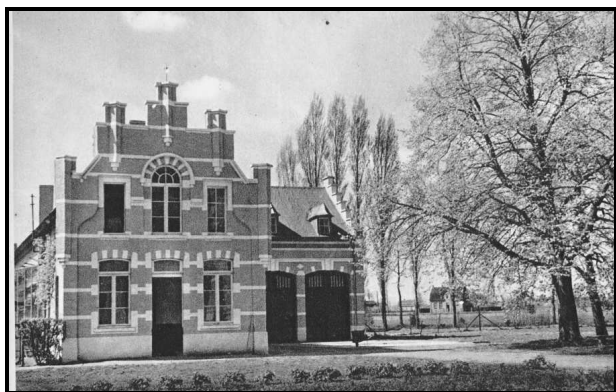
Gebouwen voormalig kruisherenklooster te Achel

246 en p. 251. Niet bij "de mannelijke religieuzen", maar onder de categorie "Achelse priesters", met een foto, en enkele gegevens uit hun curriculum.