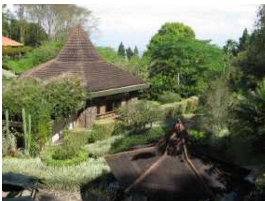
Kapel van het retraitehuis Pratista in Bandung