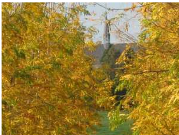
Herfstkleuren rond het klooster Sint Agatha