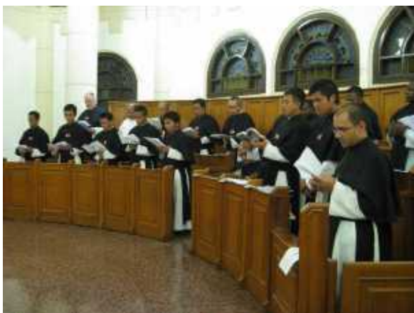
Getijdengebed in de priorij van Pratista, in mei 2013, tijdens een internationale samenkomst.

tien jaar. Zo goed is hij! Na deze viering werd de plechtigheid voortgezet met de vernieuwing – door zes confraters – van de tijdelijke professie.