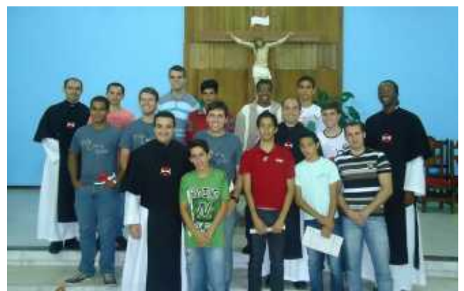
Braziliaanse medebroeders houden roepingendagen

bij hun aankomst en hun vertrek bij ons overnacht, en met ons de maaltijden gebruikt. Ze leefden mee in ons klein grijzend gemeenschapje. Ze sloten bij onze dagorde aan. Ook hebben ze de stad (Belo Horizonte/ Minas Gerais) gezien, en in een favela rondgelopen, waar wij nog steeds doende zijn.