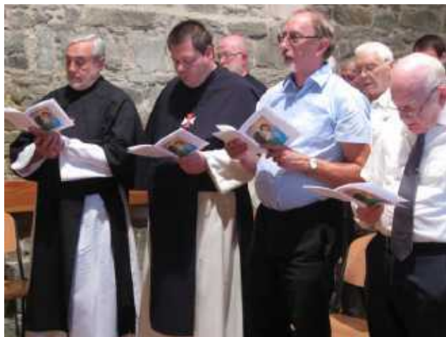
Liturgieviering tijdens het provinciaal kapittel

en bestemming doet afwijken. Dat brengt ook met zich mee dat de visie en de projecten van je leven veranderen. Zelfs zij die zich vrijwillig bij Jezus aansluiten doen dit niet zonder een of ander excuus. Er is altijd wat te regelen, er moet orde op zaken gesteld worden vooraleer men zich helemaal geeft.