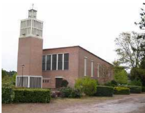
Kerk van de H. Kruisvinding

Het tweede jubilerend Godshuis, dat de Kruisheren nog nauwer aan het hart ligt is de kerk van Achel-Statie. Die bestaat 50 jaar. De officiële herdenkingsviering is op zaterdagavond 30 november 2013, met een pontificale mis (om 17.30), voorgedaan door de bisschop van Hasselt. Dan volgt een academische zitting, waar " Achel-Statie in woord en beeld " wordt voorgesteld: een nieuw boek, geïllustreerd met 300 foto's.