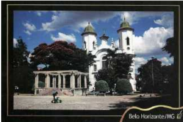
Kerk van de parochie waar de kruisheren wonen

Op een creatieve manier wordt die rijkdom aan geestelijk leven ook verder gedragen in de spontane en in georganiseerde feestelijkheden rond de twee patronessen van onze parochie.