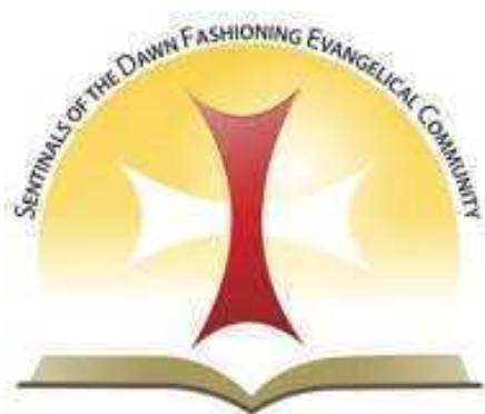
Logo voor het Generaal Kapittel van 2015

Toen een confrater opmerkte, dat wij uit elkaar zijn gegroeid en elkaar niet kennen (begrijpen?), ontstond er een lange discussie, omdat velen het daarmee niet eens waren. Er werd door meerderen vanuit persoonlijke ervaring gesproken en verteld hoe men als gemeenschap met elkaar communiceerde in Brazilië en hier in Nederland, aansluitend altijd bij wat er ter plaatse leefde.