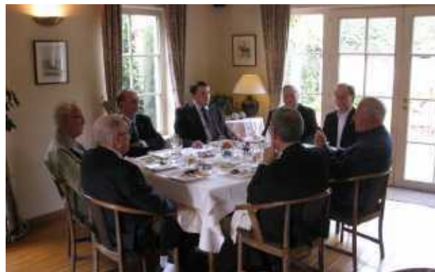
Bij het feestmaal in Aldeneik

Om deze jaarlijkse jubilarissendag af te sluiten, stond er in het klooster van Maaseik nog koffie en gebak klaar. Kort na vier uur werd van elkaar afscheid genomen, na samen te hebben genoten van een deugddoend samenzijn, dat het jubeljaar van deze confraters ongetwijfeld zal markeren.