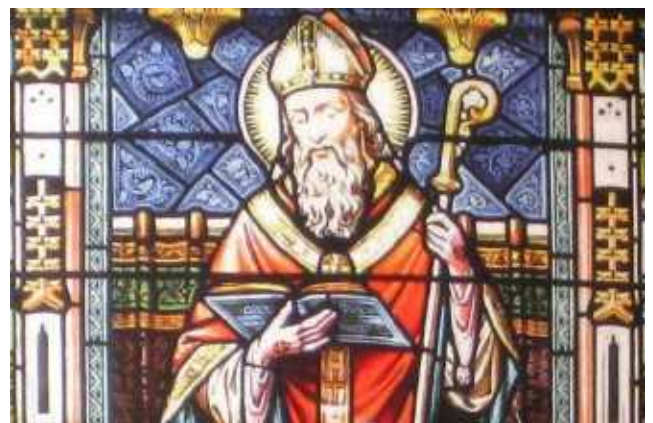
H. Gondulfus, bisschop, met evangelieboek & staf