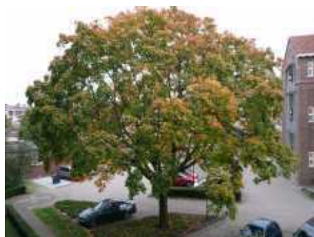
De herfst dient zich aan

pijnstillers gegeven, en een steunkous. Nog steeds heeft hij veel pijn. Hij moet van de huisdokter rust houden, maar nu moet hij ook beweging hebben. Hij deed alweer dienst als voorganger in Volkel.