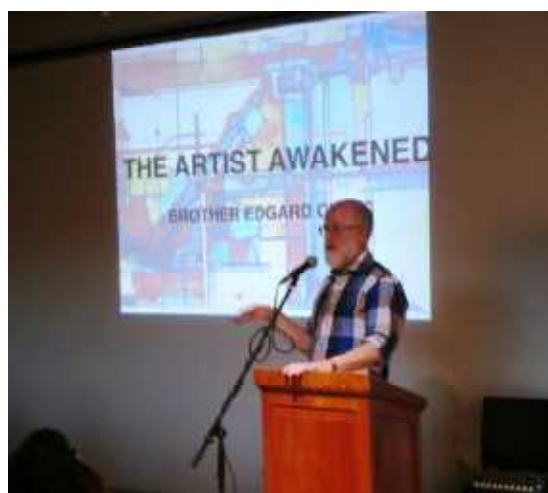
"De kunstenaar tot leven geroepen"